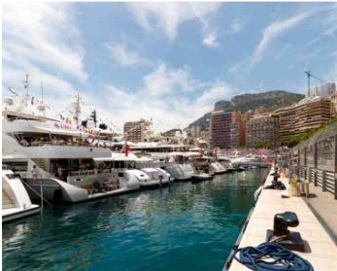
Monte Carlo: Auch eine zu kleine Jacht kann im Vergleich unglücklich machen.

kurzfristiges emotionales Wohlbefinden. Gerade 2022 stehen beide Komponenten unter hohem Druck. Das Wohlbefinden ist ja durch Corona, den Krieg in der Ukraine, starke Kursschwankungen, Inflation und andere Unsicherheiten erschüttert. Rechnen Sie darum mit nachhaltig unglücklicheren Zeiten für die Menschen?