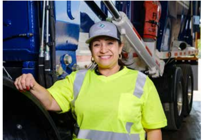
Waste Connections: Das US-Entsorgungsunternehmen hat 15.000 Angestellte.

Solch ambitionierte Vorhaben lassen sich aber nur umsetzen, wenn das traditionelle Geschäft vorläufig weiter solide Erträge liefert. Und hier ist Fondsmanager Scholl optimistisch: „In den vergangenen Jahren wurde wegen der schärferen Regulierung global zu wenig in die Erschließung und Förderung von Rohstoffen investiert.“ Dadurch sei das Angebot knapp geworden, was wiederum die Preise stütze. Rohstoffe seien dabei eminent wichtig, damit der Umbau der Wirtschaft hin zu einer nachhaltigeren Wirtschaftsweise überhaupt gelingen könne, sagt Scholl. Ohne Kupfer gibt es nun einmal keine neuen Stromleitungen und ohne Lithium keine Batterien für den Elektromotor. Energie zu erzeugen bringe wiederum erfahrungsgemäß hohe Umsatzrenditen von 15 bis 20 Prozent. Und generell seien Energie- und Rohstoffkonzerne für den Fonds eine gute Wahl, wenn sie kontinuierlich