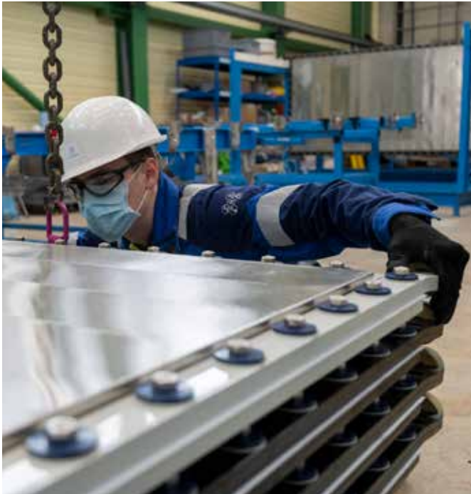
Grüne Wasserstoff-Lösung: Arbeiter von Nucera montiert Elektrolyse-Bauteil.

Die Erzeugung von regenerativen Energien ist dabei häufig stationär gebunden. Es braucht eine Energiequelle, die ähnlich wie Benzin in Verbindung mit einem Verbrennermotor flexibel und mobil einsetzbar ist. Die Brennstoffzelle wird das nach Einschätzung von Expertinnen und Experten ermöglichen. Für Unternehmen wie SFC Energy tut sich damit ein Riesenmarkt auf. Die Münchner stellen Brennstoffzellen aller Größen und Leistungsstufen her, die per Methanol oder Wasserstoffkartusche betrieben werden. Diese Mini-Kraftwerke sind als Notstromaggregat für kritische Infrastrukturanlagen einsetzbar, etwa in Krankenhäusern oder an Mobilfunkmasten.