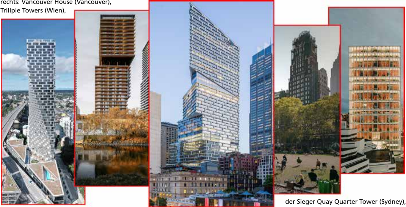
der Sieger Quay Quarter Tower (Sydney), The Bryant (New York) und Singapur State Courts (Singapur).

Die fünf Finalisten beim IHP von links nach rechts: Vancouver House (Vancouver), Trillple Towers (Wien),