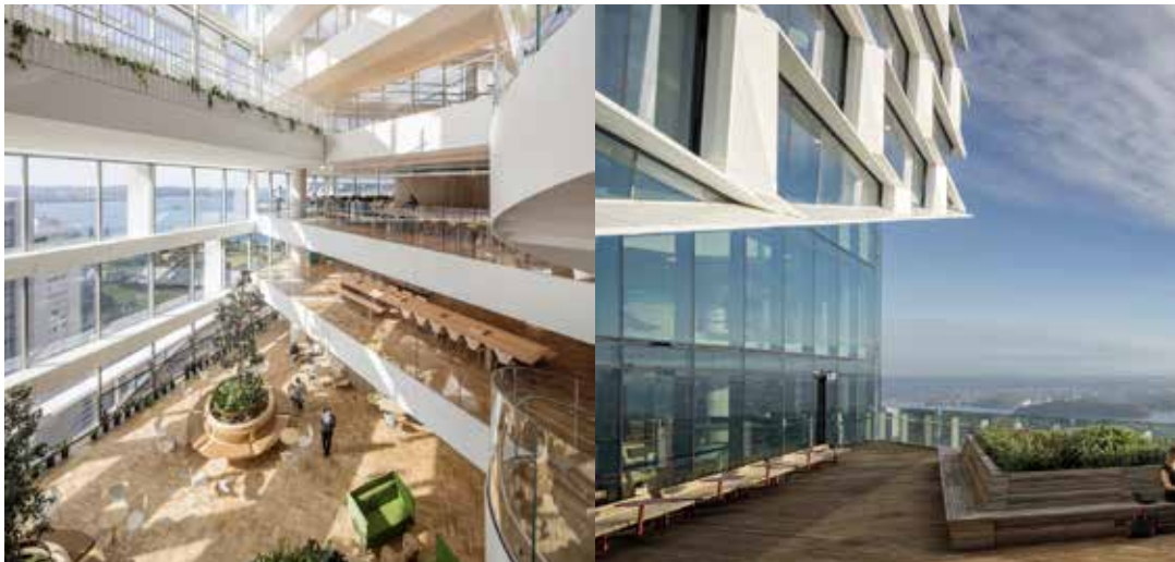
Quay Quarter Tower in Sydney: Die Atrien ermöglichen Ausblicke auf das Opernhaus und den Hafen.

Frankfurt, erklärt den Trend so: Bald werde die Welt etwa drei Milliarden Menschen unter 18 Jahren unterbringen müssen, das entspreche der gesamten Weltbevölkerung im Jahr 1930. „Das bedeutet, dass wir unsere Städte nachverdichten müssen. Um dies zu erreichen, müssen wir schlicht und einfach höher bauen. Das wird der Normalfall werden“, meint Schmal.