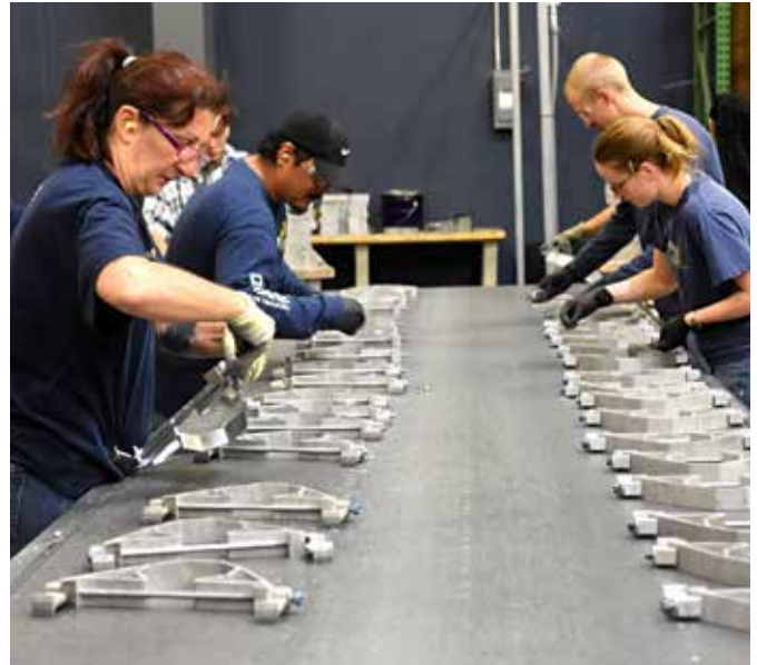
Array Technologies: Elektromotoren helfen bei der Steuerung von Solarpanels.

Nach einer gemeinsamen Studie der Unternehmensberatung McKinsey und Euro Commerce muss allein der Groß- und Einzelhandel in der Europäischen Union in den kommenden acht Jah-