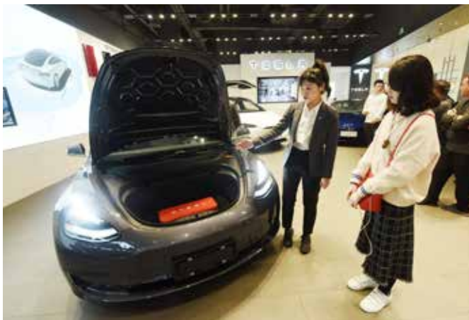
Tesla in China: Der E-Auto-Hersteller hat den Preis für das Model 3 gesenkt.

Die drei Fonds-Beispiele zeigen: Es gibt einige Möglichkeiten, trotz Krise sein Geld sinnvoll anzulegen. Alle drei Fonds können als zusätzliche Bausteine im Portfolio für eine noch größere Streuung sorgen. Vor allem bei den beiden Aktienfonds können dabei deutliche Kursverluste nicht ausgeschlossen werden, wenn die Weltwirtschaft in eine Rezession abrutscht. Denn vorerst kann es an den Kapitalmärkten erst einmal wieder zu Kursturbulenzen kommen. Manche Aktienfonds hatten deshalb bereits Kursverluste, weil sie, wie Deka-Fondsmanager Schneider betont, „keine Insel in stürmischer See“ sein könnten. Andere wiederum schaffen es im Sturm sogar, ordentliche Kursgewinne hereinzufahren.